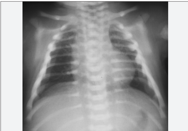
Resim 1. Kemik yapıda hiperintens görünüm