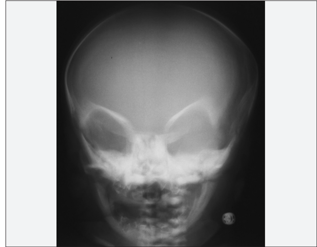
Resim 2. Kraniyografide space alien görüntüsü

sağ kasıkta inguinal herni dışında özellik yoktu. Laboratuvarında Hb: 9,9 g/dl, Hct: %28, lökosit sayısı: 11 300/mm 3 , trombosit sayısı 181 000/mm 3 , MCV: 77, periferik yaymasında % 44 lenfosit, %25 polimorf nüveli lökosit, lenfositlerin %10'u iri basofilik sitoplazmalı ve polikromazisi vardı. Biyokimyasında Ca: 9,3 mg/dl (8,4-10,2), P: 2,2 mg/dl (2,3-4,7), ALP: 1139 U/L (40-150) dışında bir özellik yoktu, karaciğer fonksiyon testleri normaldi. Viral serolojisinde toksoplasma IgG ve IgM (-), rubella IgG ve IgM (-), CMV IgG (+), avidite 0,409, CMV-DNA (PCR) negatif saptandı. Annenin CMV IgG: 0,8, CMV DNA'sı (-) di. Hastada konjenital CMV enfeksiyonu düşünülmedi. PA akciğer grafisinde (Resim 1) kemik yapıda saptanan hiperintens görüntü nedeniyle çekilen tüm vücut grafilerinde belirgin dansite artışı, kraniyografide 'space alien' görüntüsü (Resim 2), vertebra grafisinde sandviç manzarası, kosta uçlarında kostakondral bileşkelelerde genişleme olması üzerine osteopetrozis üzerine oturmuş rikets olabileceği düşünüldü (Resim 3). Batın USG'de hepatosplenomegali